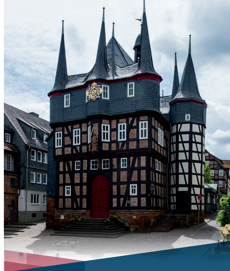
2024-06 · Irrtümer und Druckfehler vorbehalten · Gestaltung: www.hallenberger.com

Einigkeit und Recht und Freiheit für das deutsche Vaterland, danach lasst uns alle streben, brüderlich mit Herz und Hand. Einigkeit und Recht und Freiheit sind des Glückes Unterpfand. Blüh' im Glanze dieses Glückes, blühe, deutsches Vaterland.